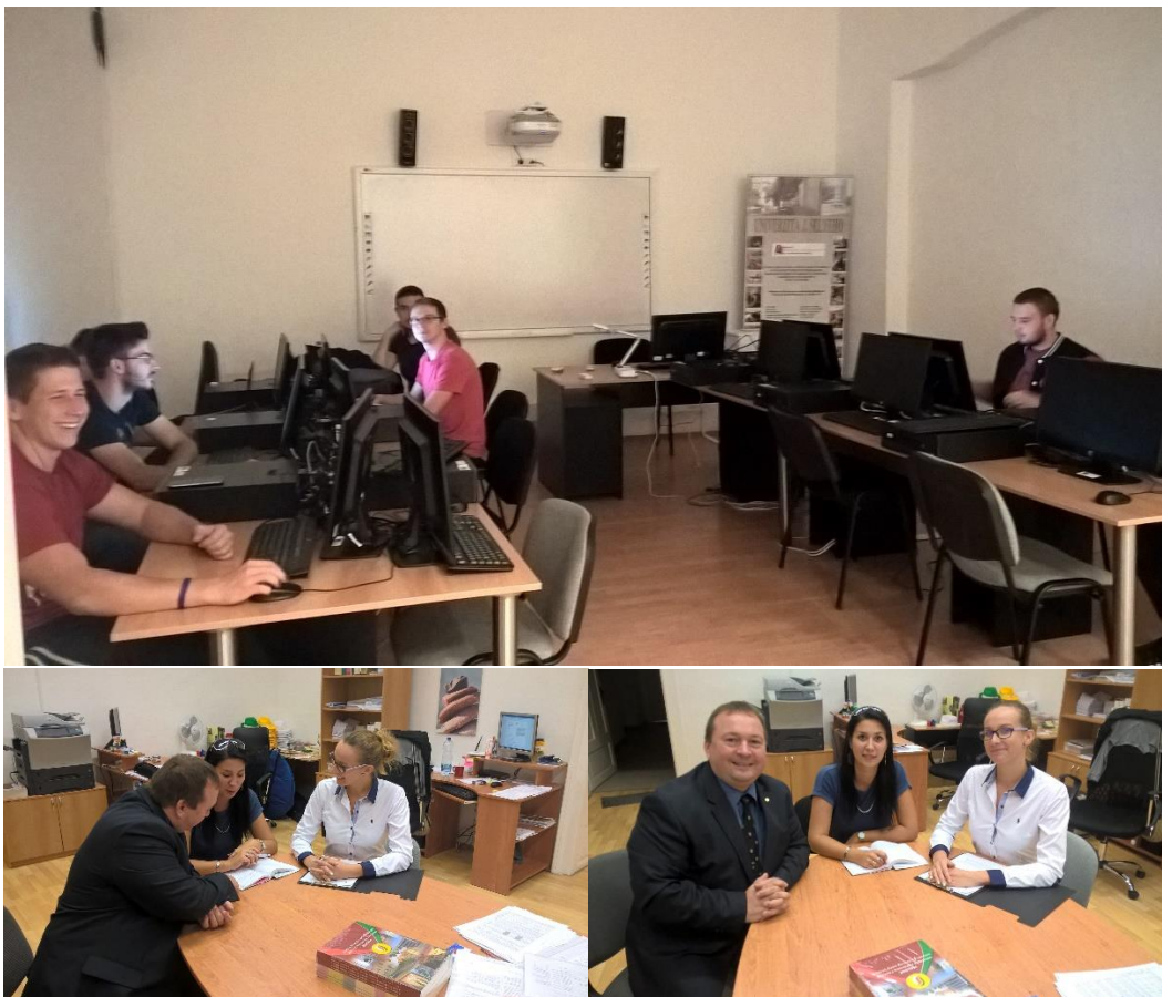
Találkozás a Selye János Egyetem hallgatóival