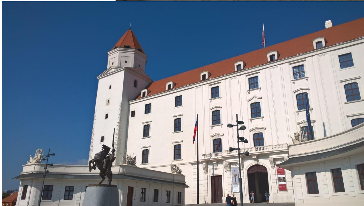
Pozsony óvárosa és a vár 2016 őszen